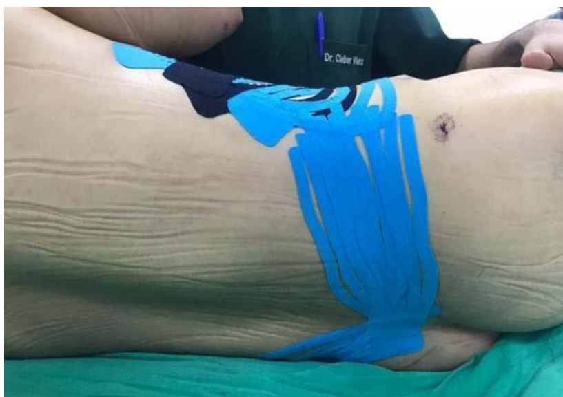
Figura 3: Taping linfático com corte “fan” na região anterior do abdome.